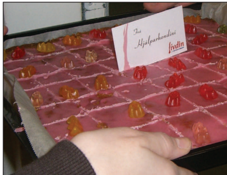
Tørvur er serliga á monnum til Hjálparhondina