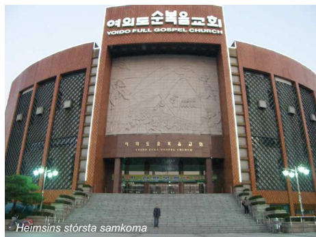
Heimsins størsta samkoma