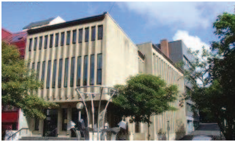
Í summarsteðginum savnast ungdomurin saman við teimum ungu í Ebenezar hvørt leygarkvøld

Eins og undanfarin ár hevur Lívini aftur í ár ein summarsteðg.